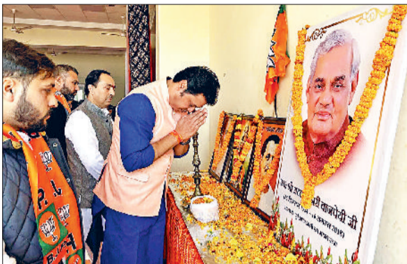
चंडीगढ़। पूर्व प्रधानमंत्री अटल बिहारी वाजपेयी की तस्वीर पर फूल श्रद्धासुमन अर्पित करते हरियाणा भाजपा के प्रभारी बिप्लव कुमार देब।