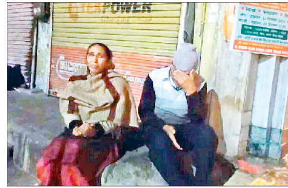
फतेहाबाद। मंदिर के बाहर बैठा दम्पति।

किसानों का कहना है कि इस तरह का मौसम खेती-किसानी के लिए फायदेमंद होता है। खासकर चना, गेहूँ, मटर, आलू, टमाटर आदि की फसल को इस सर्दी से फायदा होगा।